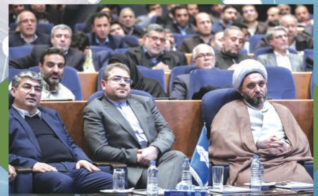
در ششمین همایش ملی مدیریت جهادی با حضور آیت اله رئیسی صورت گرفت:

تجلیل از مدیر عامل سازمان منطقه آزاد ماکو به عنوان مدیر جهادی کشور